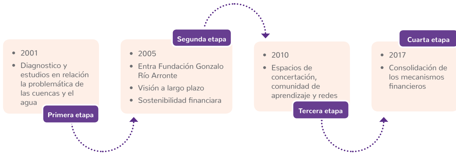
Figura 1: Etapas del proyecto

El proyecto operado por el Fondo Mexicano para la Conservación de la Naturaleza se ha dividido en cuatro etapas, de cuatro años cada una.